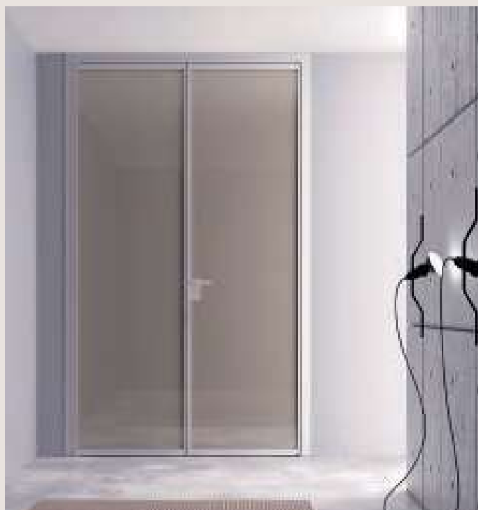
SIMPLE UNIK DOPPIO BATTENTE / Alluminio finitura Argento, Cristallo laccato Canapa, maniglia Bilbao. SIMPLE UNIK DOUBLE DOOR / Aluminum Argento, Canapa lacquered glass, Bilbao handle.