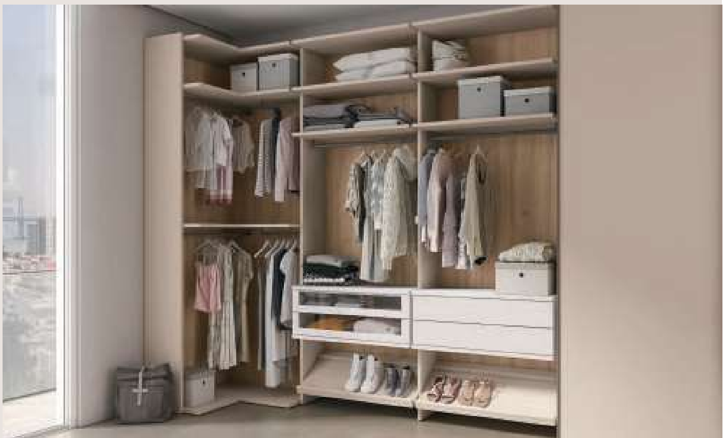
BICLOSET / Cabina armadio, nobilitato Canapa, schienali Ciliegio Nordico, tubi Grigio Titanio, cassettiere Frassino Bianco Puro. BICLOSET / Walk-in closet, Canapa melamine, backboard Ciliegio Nordico, rods Grigio Titanio, drawers Frassino Bianco Puro.