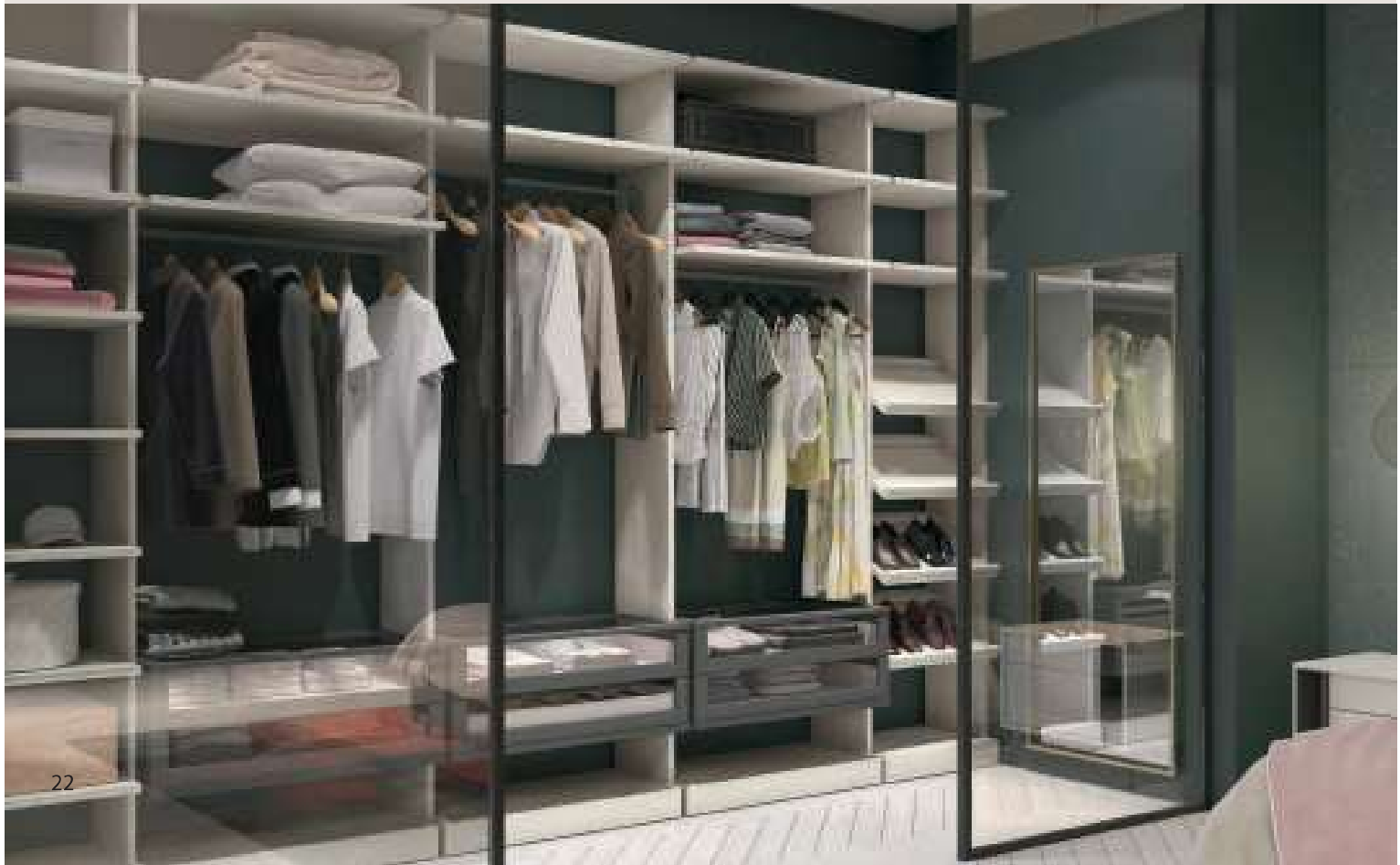
BICLOSET / Cabina armadio, struttura nobilitato Malta, tubi Argento, cassettiere Grigio Titanio. BICLOSET / Walk-in closet, structure in Malta melamine, rods in Argento, drawers in Grigio Titanio.