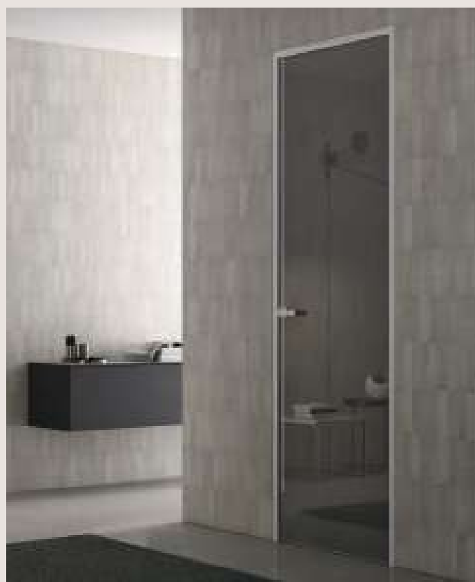
LIGHT CRYSTAL Bi BATTENTE / Alluminio Bianco, cristallo Reflex Satinato Fumé, maniglia Square Bianco. LIGHT CRYSTAL Bi HINGED / Aluminum Bianco, Reflex Satinato Fumé glass, Square Bianco handle.