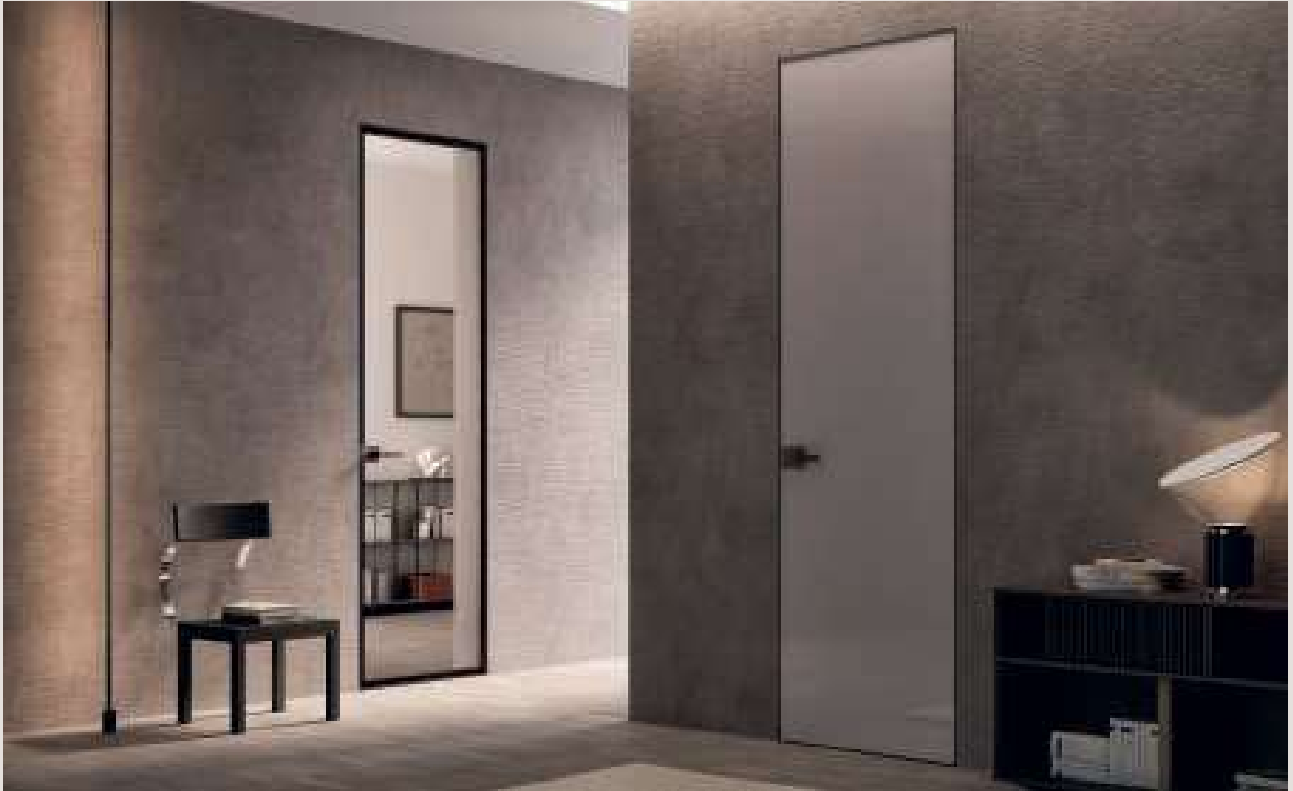
FILOMURO CRYSTAL BATTENTE / Struttura alluminio finitura Brown, cristallo Trasparente Extrachiaro, maniglia Basco Brown. FILOMURO HINGED FLUSH CRYSTAL / Aluminum structure Brown finish, Trasparent Extrachiaro glass, Basco Brown handle.

La collezione Filomuro presenta un design rigoroso ed essenziale che si armonizza con ogni tipologia di arredo. Le Filomuro si "eclissano" all'interno della parete oppure sorprendono con le loro finiture di pregio. / The Filomuro collection presents a precise yet simple design that harmonises with any type of furnishing. The Filomuro flush doors blend into the wall or surprise with their quality finishes.