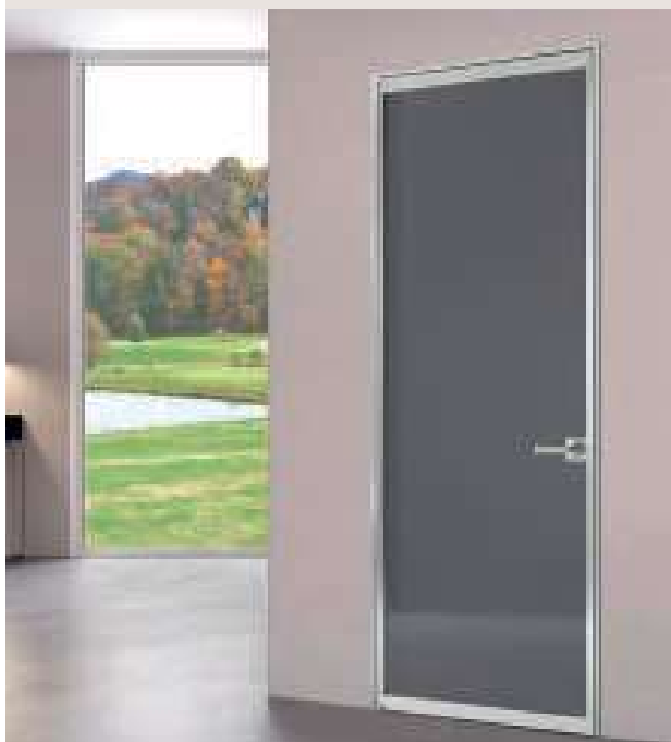
LIGHT UNIK BATTENTE / Alluminio finitura Argento, Cristallo laccato Grafite, maniglia Groningen. LIGHT UNIK HINGED / Aluminum Argento, Grafite lacquered glass, Groningen handle.

Porta a battente con struttura in alluminio, finiture: Argento, Brown, Antracite, Bianco, Cristallo di sicurezza (temperato o stratificato). / Hinged doors with aluminum structure, finishes: Argento, Brown, Antracite, Bianco. Safety glazing (tempered or laminated).