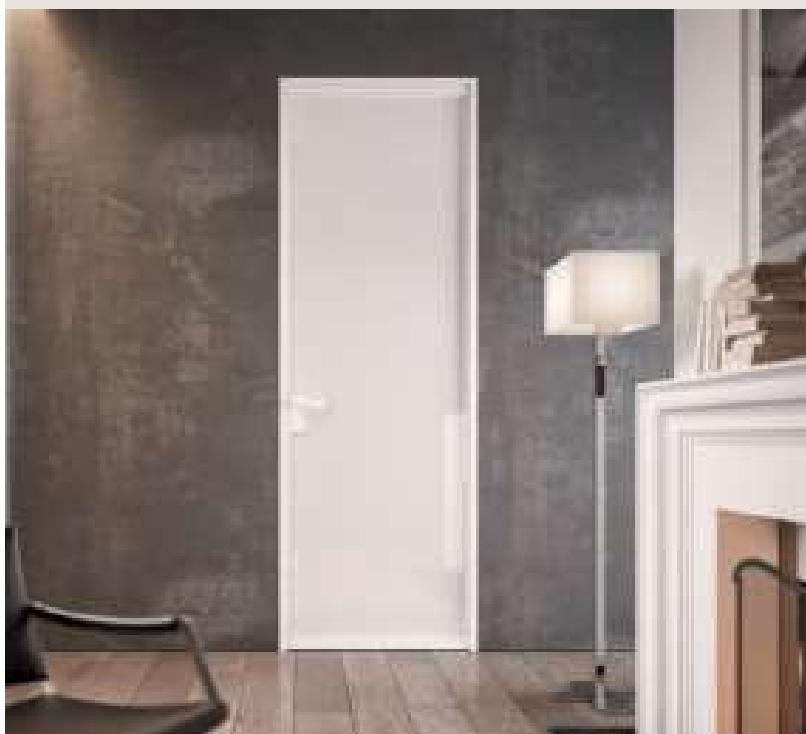
LIGHT UNIK BATTENTE / Alluminio finitura Bianco, cristallo Bianco Bifacciale Lucido, maniglia Dada Bianco. LIGHT UNIK HINGED / Aluminum frame Bianco, Bianco Bifacciale Lucido glass, Dada Bianco handle.