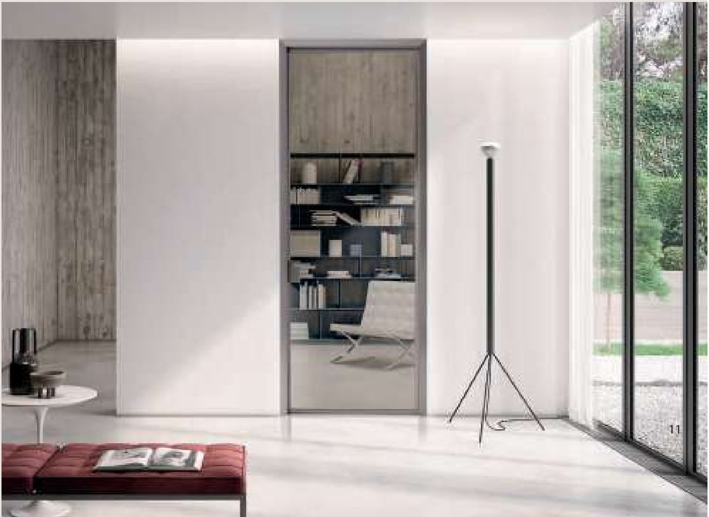
MINI TALL GLASS BATTENTE / Alluminio finitura Champagne, cristallo Trasparente Extrachiario, maniglia Sam Champagne. MINI TALL GLASS HINGED / Aluminum Champagne finish, Trasparente Extrachiario glass, Sam Champagne handle.