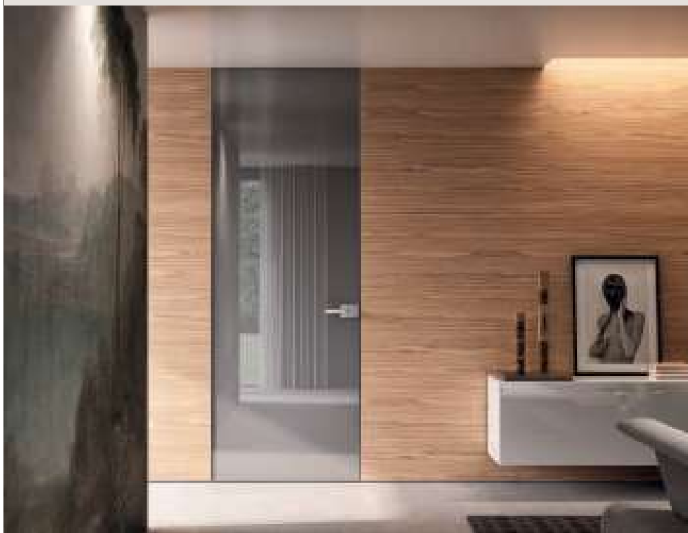
FILOMURO CRYSTAL BATTENTE / Struttura alluminio finitura Brown, cristallo laccato Canapa, maniglia Basco Brown. FILOMURO HINGED FLUSH CRYSTAL / Aluminum structure Brown finish, Canapa lacquered glass, Basco Brown handle.